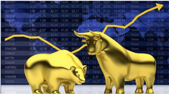
Millhouse Capital hat eigene Bank gegründet

Millhouse Capital hat eigene Bank gegründet. Damit wird nun in Zukunft die Wahrung des eigenen Vermögens und die Unabhängigkeit vom bisherigen Bankensystem gesichert.